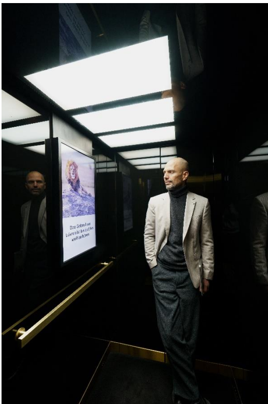
Bild 2: DooH-Spezialist HYGH vermarktet seit 2022 die Screens in Wohnhäusern mit Schindler Aufzügen. 2024 wurde die Partnerschaft um das Office-Segment erweitert.